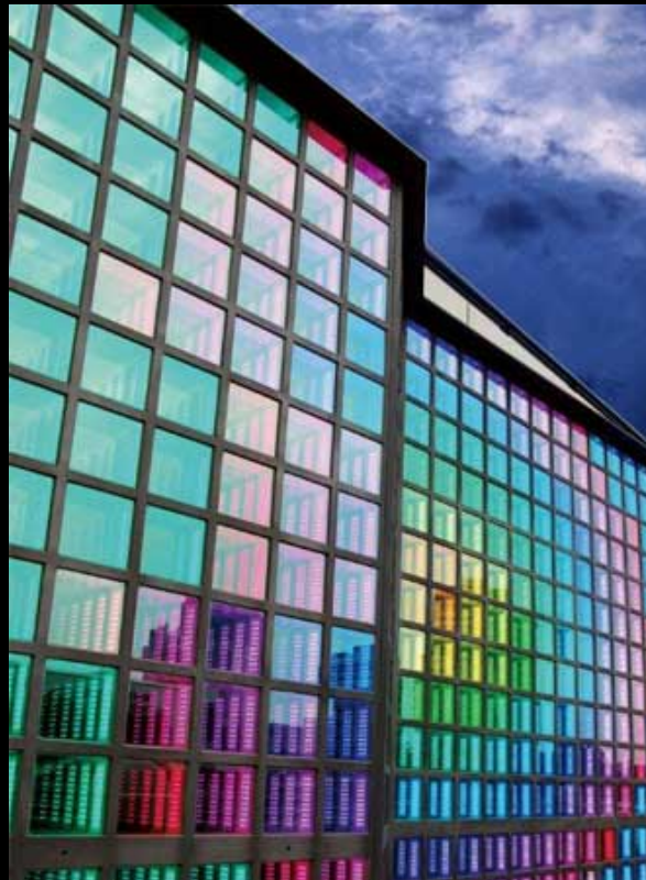
GEMINI LICHTJAHRE 2010/2011 – Professionelle Led-Beleuchtungen

Herzlich Willkommen bei Gemini Licht Ltd.